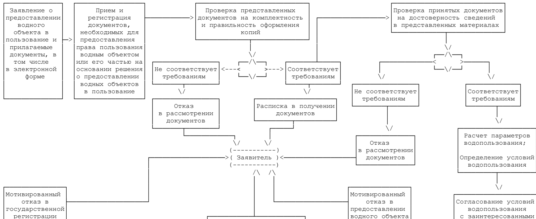
СХЕМА ПРОЦЕДУР РЕГЛАМЕНТА